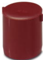
Verschlussstopfen, Material: PA, Farbe: rot

Bitte beachten Sie, dass die hier angegebenen Daten dem Online-Katalog entnommen sind. Die vollständigen Informationen und Daten entnehmen Sie bitte der Anwenderdokumentation. Es gelten die Allgemeinen Nutzungsbedingungen für Internet-Downloads. ( http://phoenixcontact.de/download )