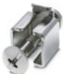
IPC-Befestigungsblock Stil C. Kompatibel mit BL FPM...

Befestigungsflansch - BL FPM MOUNTING KIT - 2403287