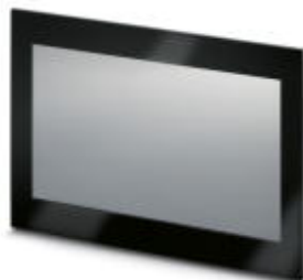
LCD-21,5-Zoll-Flachbildmonitor mit Schutzart IP65 und projiziertem kapazitivem Touchscreen

Bitte beachten Sie, dass die hier angegebenen Daten dem Online-Katalog entnommen sind. Die vollständigen Informationen und Daten entnehmen Sie bitte der Anwenderdokumentation. Es gelten die Allgemeinen Nutzungsbedingungen für Internet-Downloads. ( http://phoenixcontact.de/download )