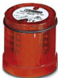
LED-Rundumlichtelement, 24 V AC/DC, rot

Bitte beachten Sie, dass die hier angegebenen Daten dem Online-Katalog entnommen sind. Die vollständigen Informationen und Daten entnehmen Sie bitte der Anwenderdokumentation. Es gelten die Allgemeinen Nutzungsbedingungen für Internet-Downloads. ( http://phoenixcontact.de/download )