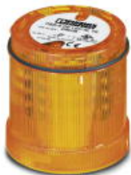
LED-Rundumlichtelement, 24 V AC/DC, gelb

Bitte beachten Sie, dass die hier angegebenen Daten dem Online-Katalog entnommen sind. Die vollständigen Informationen und Daten entnehmen Sie bitte der Anwenderdokumentation. Es gelten die Allgemeinen Nutzungsbedingungen für Internet-Downloads. ( http://phoenixcontact.de/download )