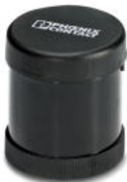
Sirenelement, 7 Töne, 24 V DC, max. 100 dB(A), Tonauswahl über 3 Signalleitungen, schwarz

Bitte beachten Sie, dass die hier angegebenen Daten dem Online-Katalog entnommen sind. Die vollständigen Informationen und Daten entnehmen Sie bitte der Anwenderdokumentation. Es gelten die Allgemeinen Nutzungsbedingungen für Internet-Downloads. ( http://phoenixcontact.de/download )