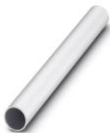
Rohr, 1000 mm lang, Ø 25 mm

Bitte beachten Sie, dass die hier angegebenen Daten dem Online-Katalog entnommen sind. Die vollständigen Informationen und Daten entnehmen Sie bitte der Anwenderdokumentation. Es gelten die Allgemeinen Nutzungsbedingungen für Internet-Downloads. ( http://phoenixcontact.de/download )