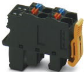
Axioline F-Einspeisestecker kurz (für z. B. AXL F BK ...)

Bitte beachten Sie, dass die hier angegebenen Daten dem Online-Katalog entnommen sind. Die vollständigen Informationen und Daten entnehmen Sie bitte der Anwenderdokumentation. Es gelten die Allgemeinen Nutzungsbedingungen für Internet-Downloads. ( http://phoenixcontact.de/download )