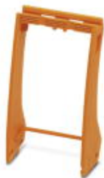
Relaishaltebügel, mit Aufnahme für Markierungsmaterial, passend für Relaissockel RIF-4, für Hochleistungsrelais

Bitte beachten Sie, dass die hier angegebenen Daten dem Online-Katalog entnommen sind. Die vollständigen Informationen und Daten entnehmen Sie bitte der Anwenderdokumentation. Es gelten die Allgemeinen Nutzungsbedingungen für Internet-Downloads. ( http://phoenixcontact.de/download )