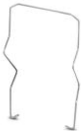
Relaishaltebügel, Drahtausführung, passend für Relaissockel RIF-4

Bitte beachten Sie, dass die hier angegebenen Daten dem Online-Katalog entnommen sind. Die vollständigen Informationen und Daten entnehmen Sie bitte der Anwenderdokumentation. Es gelten die Allgemeinen Nutzungsbedingungen für Internet-Downloads. ( http://phoenixcontact.de/download )