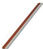
Endlossteckbrücke, Länge: 500 mm, Farbe: rot

Endlossteckbrücke - FBST 500-PLC RD - 2966786