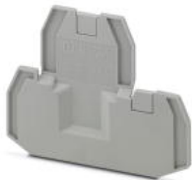
Abschlussdeckel, Länge: 75,6 mm, Breite: 2,2 mm, Höhe: 57,5 mm, Farbe: grau

Bitte beachten Sie, dass die hier angegebenen Daten dem Online-Katalog entnommen sind. Die vollständigen Informationen und Daten entnehmen Sie bitte der Anwenderdokumentation. Es gelten die Allgemeinen Nutzungsbedingungen für Internet-Downloads. ( http://phoenixcontact.de/download )