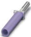
Prüfsteckerbuchse, Farbe: violett

Prüfsteckerbuchse - PSBJ-URTK/S VT - 0311773