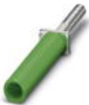
Prüfsteckerbuchse, Farbe: grün

Prüfsteckerbuchse - PSBJ-URTK/S GN - 0311760