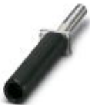
Prüfsteckerbuchse, Farbe: schwarz

Prüfsteckerbuchse - PSBJ-URTK/S BK - 0311728