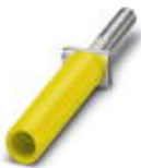
Prüfsteckerbuchse, Farbe: gelb

Prüfsteckerbuchse - PSBJ-URTK/S YE - 0311731