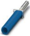
Prüfsteckerbuchse, Farbe: blau

Prüfsteckerbuchse - PSBJ-URTK/S BU - 0311757