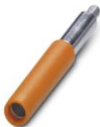
Prüfsteckerbuchse, Farbe: orange

Bitte beachten Sie, dass die hier angegebenen Daten dem Online-Katalog entnommen sind. Die vollständigen Informationen und Daten entnehmen Sie bitte der Anwenderdokumentation. Es gelten die Allgemeinen Nutzungsbedingungen für Internet-Downloads. ( http://phoenixcontact.de/download )