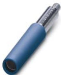
Prüfsteckerbuchse, Farbe: blau

Bitte beachten Sie, dass die hier angegebenen Daten dem Online-Katalog entnommen sind. Die vollständigen Informationen und Daten entnehmen Sie bitte der Anwenderdokumentation. Es gelten die Allgemeinen Nutzungsbedingungen für Internet-Downloads. ( http://phoenixcontact.de/download )