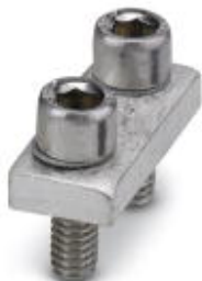
Feste Brücke, Polzahl: 2, Farbe: silberfarben

Bitte beachten Sie, dass die hier angegebenen Daten dem Online-Katalog entnommen sind. Die vollständigen Informationen und Daten entnehmen Sie bitte der Anwenderdokumentation. Es gelten die Allgemeinen Nutzungsbedingungen für Internet-Downloads. ( http://phoenixcontact.de/download )