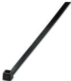
Kabelbinder, Standardversion, für eine schnelle und sichere Bündelung

Bitte beachten Sie, dass die hier angegebenen Daten dem Online-Katalog entnommen sind. Die vollständigen Informationen und Daten entnehmen Sie bitte der Anwenderdokumentation. Es gelten die Allgemeinen Nutzungsbedingungen für Internet-Downloads. ( http://phoenixcontact.de/download )