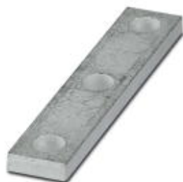
Verbindungsschiene, Polzahl: 3, Farbe: silberfarben

Bitte beachten Sie, dass die hier angegebenen Daten dem Online-Katalog entnommen sind. Die vollständigen Informationen und Daten entnehmen Sie bitte der Anwenderdokumentation. Es gelten die Allgemeinen Nutzungsbedingungen für Internet-Downloads. ( http://phoenixcontact.de/download )