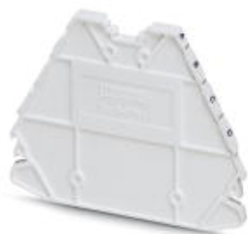
Abschlussdeckel, Länge: 63,6 mm, Breite: 2,2 mm, Höhe: 48,9 mm, Farbe: weiß

Bitte beachten Sie, dass die hier angegebenen Daten dem Online-Katalog entnommen sind. Die vollständigen Informationen und Daten entnehmen Sie bitte der Anwenderdokumentation. Es gelten die Allgemeinen Nutzungsbedingungen für Internet-Downloads. ( http://phoenixcontact.de/download )