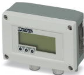
Procesní indikátor napájený z výstupní smyčky s komunikací HART v pouzdru pole

Upozorňujeme, že zde uvedené údaje pocházejí z online katalogu. Úplné informace a údaje naleznete v uživatelské dokumentaci. Platí všeobecné podmínky použití pro stahování z internetu. ( http://phoenixcontact.de/download )