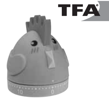
Kat. Nr. 38.1040

Thank you for choosing this instrument from TFA.