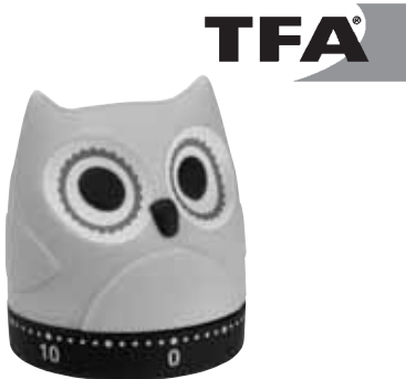
Kat. Nr. 38.1039

Vielen Dank, dass Sie sich für dieses Gerät aus dem Hause TFA entschieden haben.