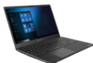
Sichtschutzfilter, beidseitig, selbsthaftend (PX1905E-2NAC)