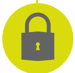
Secure 3 point lock