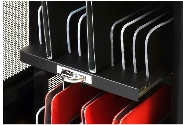
Sliding shelves Tiroirs coulissants