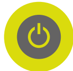
Charge indicator LEDs