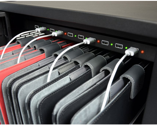
Charge progress LED indicator Indicateur LED de progression de charge