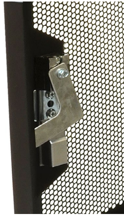
3 points lock Fermeture 3 points