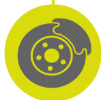
Omnidirectional wheels + brakes