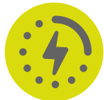
Smart charge 5 volt USB port