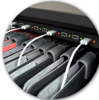
Charge progress LED indicator Indicateur LED de progression de chargement