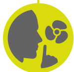
Silent cooling stand