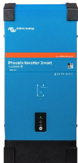
Inversor Phoenix Smart 12/2000