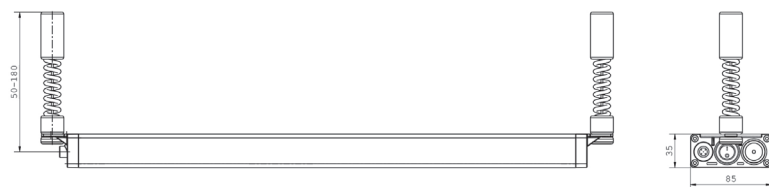
Abbildung zeigt Zuggendelversion / figure shows version with adjustable drawbars