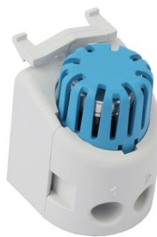
TFC 35 Art.-Nr. 15 TFC 035