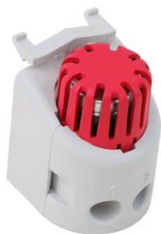
TFH 05 Art.-Nr. 15 TFH 005