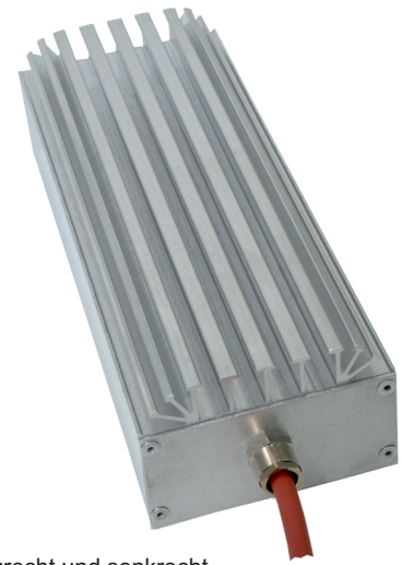
Waagrecht und senkrecht einsetzbar Horizontal and vertical use