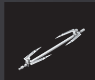
PINCHO PARA POLLO