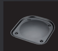
BANDEJA DE ACEITE