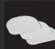
3 x BANDEJAS DE REJILLA