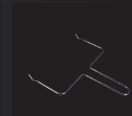
MANGO PARA EXTRAER LOS ACCESORIOS