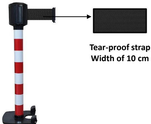
Tear-proof strap Width of 10 cm

Range : WELCOME Code HSS: 7326909890 EAN : 3321360037749