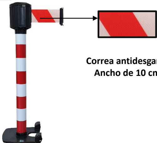
Correa antidesgarro Ancho de 10 cm

Gama : WELCOME Code HSS: 7326909890 EAN : 3321360033192