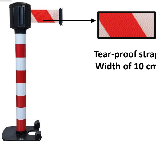
Tear-proof strap Width of 10 cm

Range : WELCOME Code HSS: 7326909890 EAN : 3321360033192