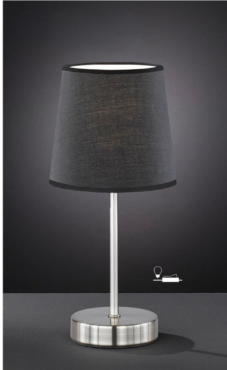
Wortmann & Filz GmbH · Im Langel 6 · 59872 Meschede-Freienohl Phone +49 (0) 29 03 / 449-0 · Fax +49 (0) 449-114 · www.wofi.de · info@wofi.de