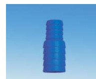
Entlüftungsstutzen vent connection C1.0605.01