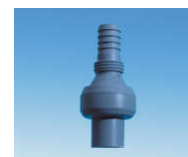
Rückschlagventil entlüftet vented non- return-valve 3004.53.00