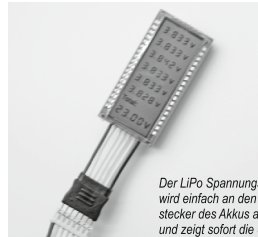
Der LiPo Spannungsprüfer wird einfach an den Balancerstecker des Akkus angesteckt und zeigt sofort die Spannung der Einzelzellen sowie die Gesamtspannung an.