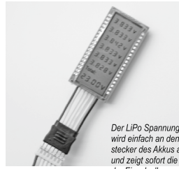
Der LiPo Spannungsprüfer wird einfach an den Balancerstecker des Akkus angesteckt und zeigt sofort die Spannung der Einzelzellen sowie die Gesamtspannung an.