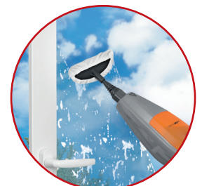
Vliesaufsatz zur gründlichen Reinigung