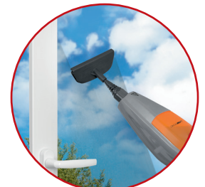
Fensterreinigungsaufsatz, reinigt ohne Putzstreifen und Kalkrückstände