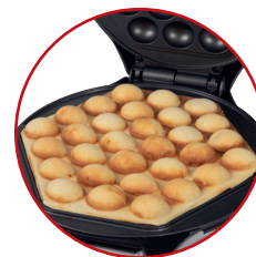
Große Backflächen in 6-eckiger Form (antihftbeschichtet)