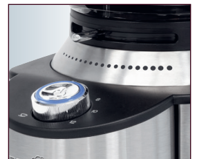
16-stufiger, einstellbarer Mahlgrad (grob bis extra fein)