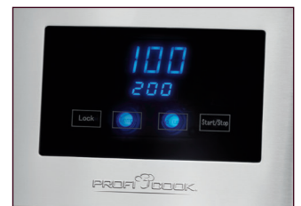
LED-Display / Sensor Touch-Bedienung