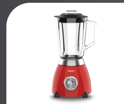
Cuerpo de acero inox, pintado en rojo metálico Stainless steel housing, painted in red metallic colour Corps en acier inoxydable, peint en rouge métallisé Corpo de aço inoxidável, pintado em vermelho metálico Edelstahlgehäuse in Metallic-Rot lackiert Corpo in acciaio inossidabile, verniciato rosso metallizzato