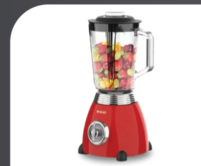
Ideal para picar, mezclar, licuar y moler Ideal for chopping, mixing, blending, liquifying & grinding Idéal pour hacher, mélanger, mélanger et broyer Ideal para cortar, misturar, misturar e moer Ideal zum Hacken, Mixen, Mixen und Mahlen Ideale per tritare, mescolare, frullare e macinare