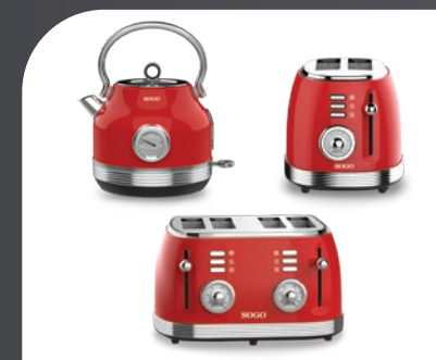
Productos Serie Retro Retro Serie products Produits de la Série Rétro Produtos da Série Rétro Produkte der Retro-Serie Prodotti della Serie Rétro