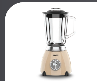
Cuerpo de acero inox, pintado en beige metálico Stainless steel housing, painted in beige metallic colour Corps en acier inoxydable, peint en beige métallisé Corpo de aço inoxidável, pintado em bege metálico Edelstahlgehäuse in Metallic-Beige lackiert Corpo in acciaio inossidabile, verniciato beige metallizzato