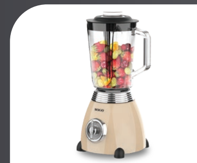
Ideal para picar, mezclar, licuar y moler Ideal for chopping, mixing, blending, liquifying & grinding Idéal pour hacher, mélanger, mélanger et broyer Ideal para cortar, misturar, misturar e moer Ideal zum Hacken, Mixen, Mixen und Mahlen Ideale per tritare, mescolare, frullare e macinare