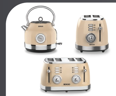
Productos Serie Retro Retro Serie products Produits de la Série Rétro Produtos da Série Rétro Produkte der Retro-Serie Prodotti della Serie Rétrò