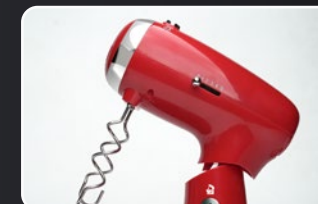
Ganchos de acero inoxidable para amasar Crochets pétrisseurs en acier inoxydable Edelstahl Taighaken