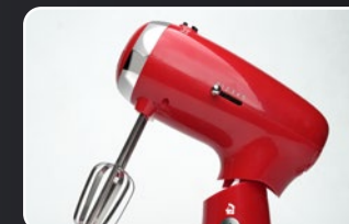
Varillas de acero inoxidable Batteurs en acier inoxydable Edelstahlklopfer