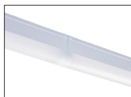
direkt miteinander anschließbar