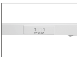
Farbwahlschalter auf der Unterseite