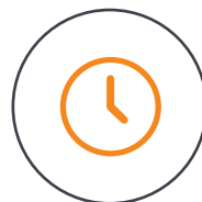
Gehärtetes Glas für eine lange Lebensdauer