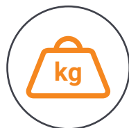
Kompakt und tragbar