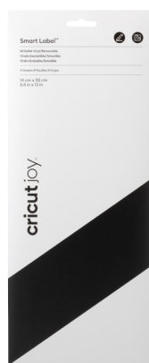
Cricut Joy Smart Label Beschreibbares Vinyl