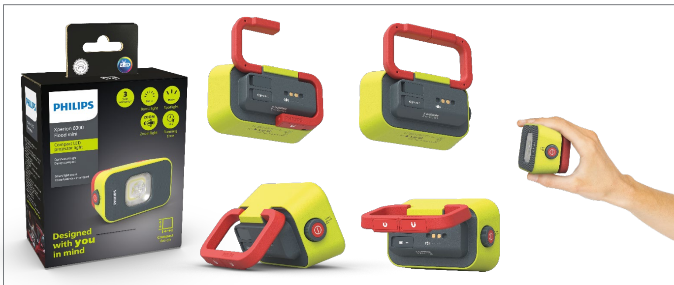
X1 Verpackung, Inhalt 1 LED-Arbeitsleuchte