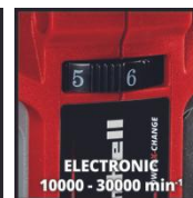
ELECTRONIC 10000 - 30000 min -1