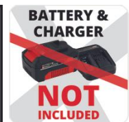
BATTERY & CHARGER NOT INCLUDED