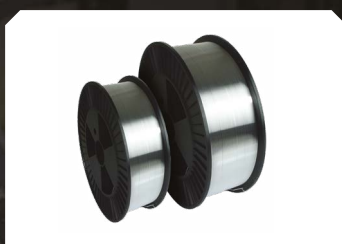
Hilo de aluminio (AlMg5)