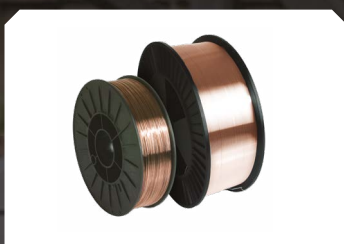
Hilo de acero SG2 Hilo Acero Inoxidable (316LSi)