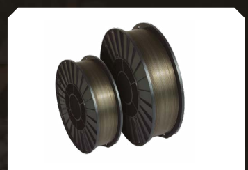
Hilo revestido - Acero