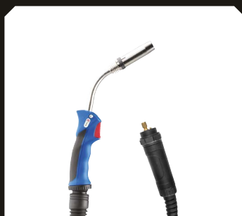
Antorcha MIG/MAG Acero/Acero inoxidable