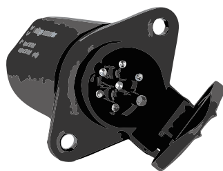
7 pol. ISO 1185 24Volt