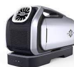
Zero Breeze Mark 2 (meistverkauftes Konkurrenzprodukt)