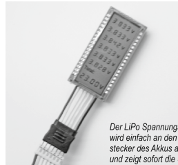
Der LiPo Spannungsprüfer wird einfach an den Balancerstecker des Akkus angesteckt und zeigt sofort die Spannung der Einzelzellen sowie die Gesamtspannung an.