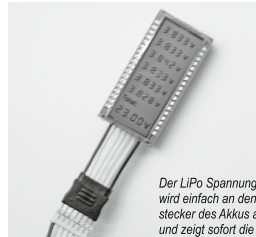
Der LiPo Spannungsprüfer wird einfach an den Balancerstecker des Akkus angesteckt und zeigt sofort die Spannung der Einzelzellen sowie die Gesamtspannung an.